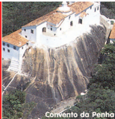
Convento da Penha